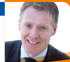
DANIELE DE ZEN Sindaco

Cari Concittadini, anche quest'anno abbiamo rinnovato l'impegno con la Ditta Grafì Comunicazione di formulare il notiziario "è Maser Notizie" per 5 edizioni semestrali, da qui al 2017. Quindi va fatto un ringraziamento a tutte quelle aziende che, aderendo come sponsor al giornalino, permettono all'Amministrazione comunale di informare gratuitamente i Cittadini di Maser sull'andamento economico-finanziario, sui lavori pubblici e su tutte quelle attività che l'Ente gestisce nel territorio proprio. L'obiettivo di questa Amministrazione è quello di rendere un servizio di informazione chiaro e comprensibile da parte di tutti.