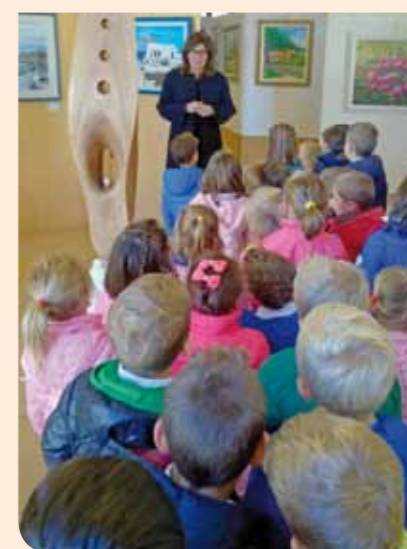
I bambini della Scuola dell'Infanzia di Crespignaga